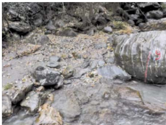
Fig. 3. Invaso di Valgrosina: confronto fotografico della deposizione dei sedimenti nell'alveo della stazione n. 1 ante-svaso (sinistra) e post-svaso (destra).