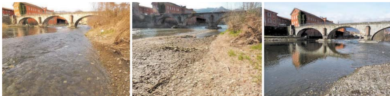
Fig. 5. Invaso di Creva: confronto fotografico della deposizione dei sedimenti nell'alveo della stazione n. 3, prima dell'immissione nel Lago Maggiore in fase pre-svaso (sinistra) e post-svaso a 3 mesi (centro) e a 1 anno (destra) dalle operazioni.

Le concentrazioni medie dei SST, durante il periodo dello svaso, alla stazione 1, sono riportate in tabella II.