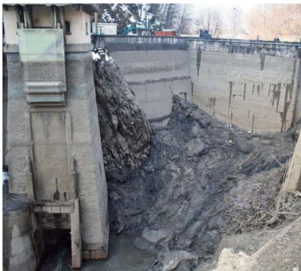
Fig. 4. La diga di Creva durante lo svaso del 2012.

Il primo Progetto di Gestione risale al 2008; successivamente, nel 2012, è stato effettuato un suo aggiornamento (Enel Produzione, 2012). Tra il 2011 e il 2012, per poter effettuare attività ispettive e di manutenzione dello scarico di fondo, sono stati eseguiti due svassi totali del bacino durante il periodo di magra